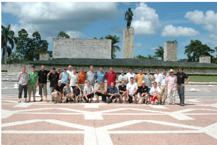
Gruppenbild vor dem Che Guevara Mausoleum in Santa Clara

Tags darauf wartete die Altstadt von Cienfuegos auf uns. Die Einwohner sind sehr stolz auf ihre Stadt und sie bemühten sich sehr, die Gebäude im alten Glanz erscheinen zu lassen. Doch blieb uns nicht viel Zeit, denn es ging schon weiter in Richtung Trinidad. Dort erwartete uns die nächste Gastgruppe, traditionell in einer gemütlichen Bar. Hier konnten wir zum zweiten Mal unser Bestes von uns geben. Auch die kubanischen Musiker ließen sich nicht lange bitten. Später kam es sogar noch zum Erfahrungsaustausch, der leider viel zu früh abgebrochen werden musste.