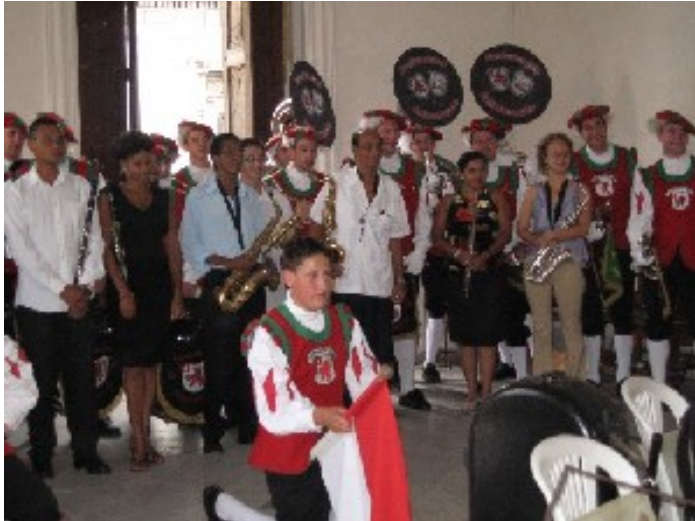
Auftitt und Austausch mit dem kubanischen Staatsorchester von Havanna

Abends hatten wir unseren Auftritt mit der Gastkapelle aus Havanna. Zum ersten Mal kollidierten Fanfarentöne mit karibischen Rhythmen und formten einen wohlschmeckenden Musikcocktail. Bei der Gastgruppe handelte es sich um eine kubanische Musikkapelle, die instrumententechnisch nicht weit entfernt ist von ihren schwäbischen Pendants. Die