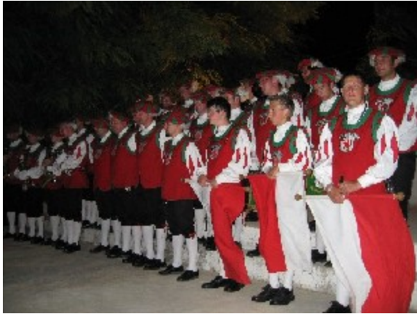
Konzert im Kulturzentrum Varaderos

Uns zog es noch am gleichen Tag weiter quer durch die Insel Richtung Norden. Dort erwarteten uns die paradiesischen Strände Varaderos. Drei Tage Sonne, Strand und Meer standen auf dem Programm. Und auch hier gaben wir Konzerte. Der Kulturverein Varaderos empfing uns herzlichst und wir standen sogar auf dem Showprogramm des Hotels Sol Sirenas.